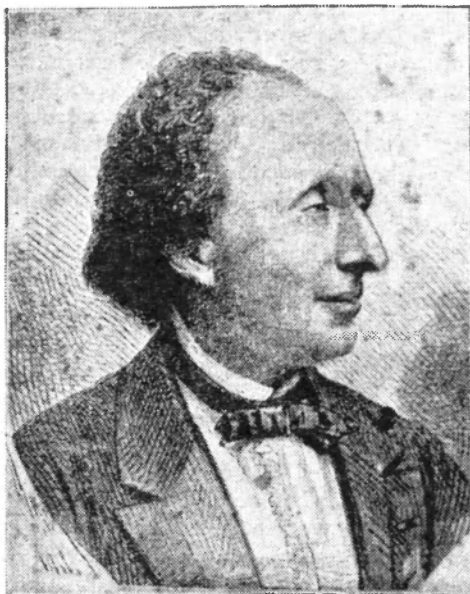
Hans Cristian Andersen

(En El Nacional de México, D. F. Abril 3 de 1950)